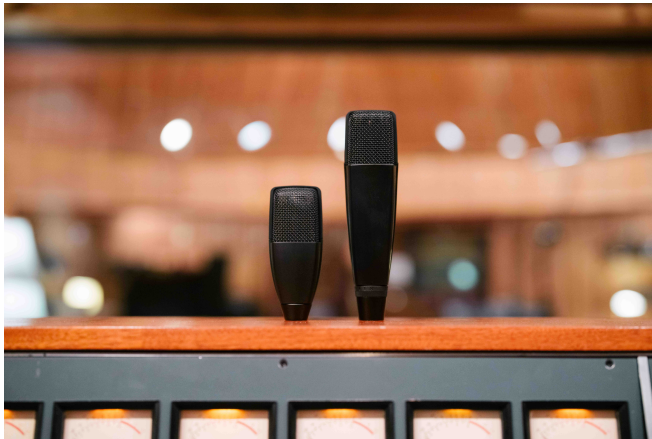
Le MD 421 Kompakt à grand diaphragme offre le même son légendaire que le MD 421-II (à droite).