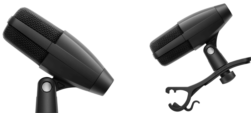
Le MD 421 Kompakt (à gauche) et sa version dédiée aux percussions, livrée avec une pince supplémentaire MZH

Paris 9 octobre 2024 – On dit que si vous avez déjà écouté de la musique, il est probable que vous ayez entendu le MD 421, un microphone Sennheiser qui a joué un rôle clé dans d'innombrables performances et productions primées au cours des six dernières décennies. Aujourd'hui, Sennheiser présente le MD 421 Kompakt, un microphone incroyablement polyvalent qui offre les mêmes performances légendaires, mais dans un format véritablement multifonctionnel — incluant une pince de fixation entièrement repensée. Le MD 421 Kompakt dispose d'une directivité cardioïde et d'une large plage dynamique, offrant une reproduction sonore cristalline, que ce soit en live ou en studio.